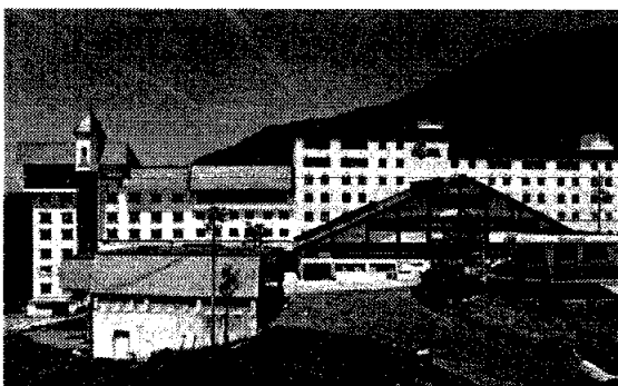
ホテルタガワ(イメージ)